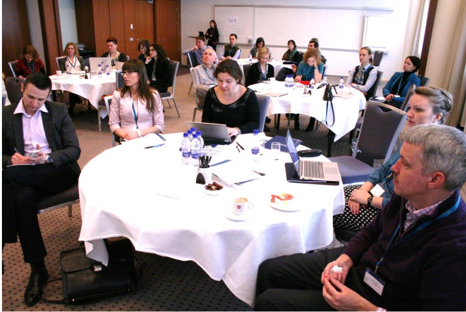
Frá fundi ETC- Market Intelligence Group í Reykjavík

Rannsóknahópurinn á yfir 30 ára sögu og innan hans starfa margir helstu sérfræðingar á sviði rannsókna og gagnaöflunar í ferðaþjónustu í Evrópu. Á fundinum í Reykjavík var farið yfir nýjustu rannsóknir og stefnur og strauma í ferðaþjónustu, ásamt því sem rannsakendur frá mismunandi Evrópulöndum deildu niðurstöðum sínum og skiptust á skoðunum. Þá var einnig lagður grunnur að því hvaða, eða hvers konar rannsóknum ætti að stefna að á næstu misserum.