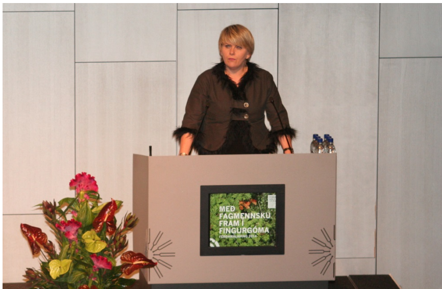
Ragnheiður Elín Árnadóttir, ráðherra ferðamála, ávarpar Ferðamálaþing 2014.